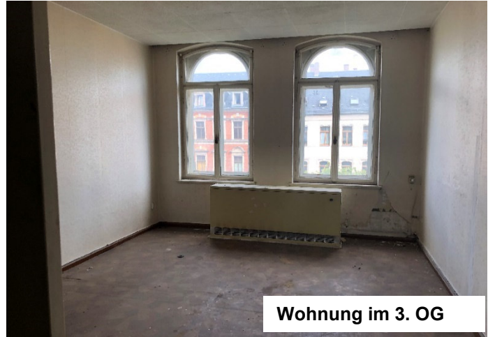
Wohnung im 3. OG