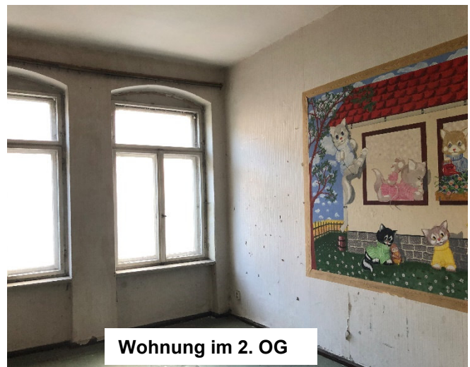
Wohnung im 2. OG

Das Immobilienangebot ist freibleibend. Für die Richtigkeit und Vollständigkeit der Angaben wird keine Haftung übernommen.