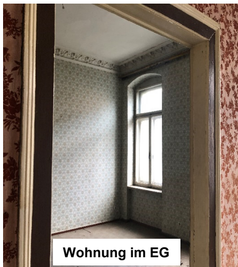
Wohnung im EG